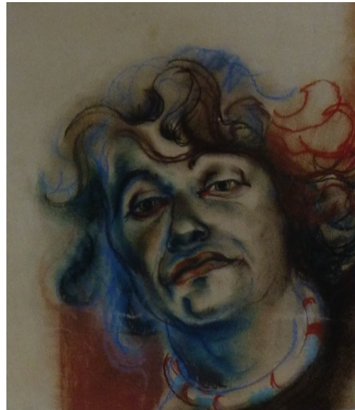
Die Absinth-Trinkerin (Selbstbildnis), um 1931. Pastell, 36 x 32 cm. Privatsammlung.

Elfriede Lohse-Wächtler 1899 – 1940. Leben und Werk. Köln 1996.