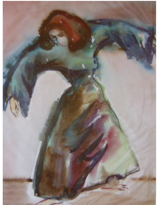
Tänzerin, um 1939. Aquarell, 53 x 42 cm