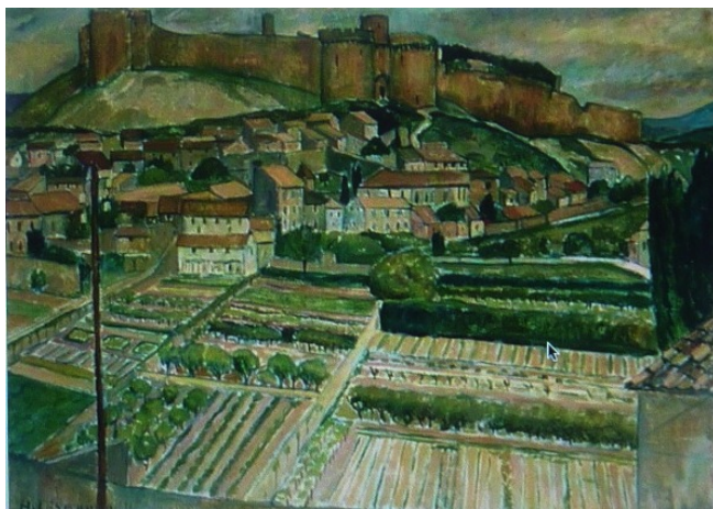
Vieille Ville, France. Öl/Lw, 66 x 91,5 cm Sotheby's Amsterdam 14.3.2007